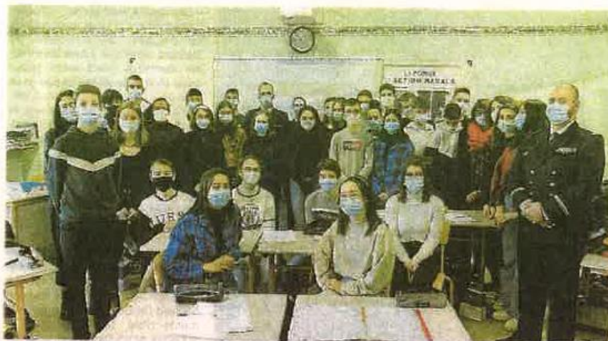
Quatre membres de l'équipage A de la Frégate multi-missions Aquitaine se sont rendus à la rencontre des élèves de 3 e , jeudi 11 février, au collège Antoine de Saint-Exupéry.

« Aujourd'hui, le monde est dans une phase de réarmement. Il n'y a pas un pays qui ne réarme pas. La Marine a besoin de RH [ressources humaines, NDLR] motivées, pour servir dans tous les bâtiments ».