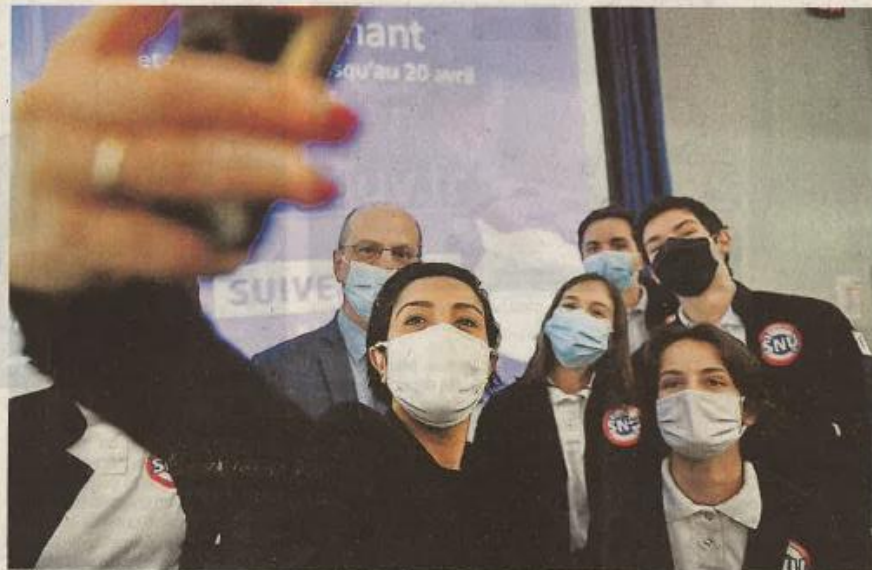
Séance de selfies avec les jeunes venus témoigner de leur expérience du SNU, pour Sarah El Hairy et Jean-Michel Blanquer.

Logo bleu blanc rouge, polo blanc, veste et pantalon bleu marine : vêtus de l'uniforme, Camille et ses camarades ont fait l'éloge du Snu, qui comprend un stage de cohésion de deux semaines (dans un autre département que le sien), avec par exemple des ateliers sur la mémoire nationale, le secourisme ou encore l'autodéfense, suivi d'une mission d'intérêt gé-