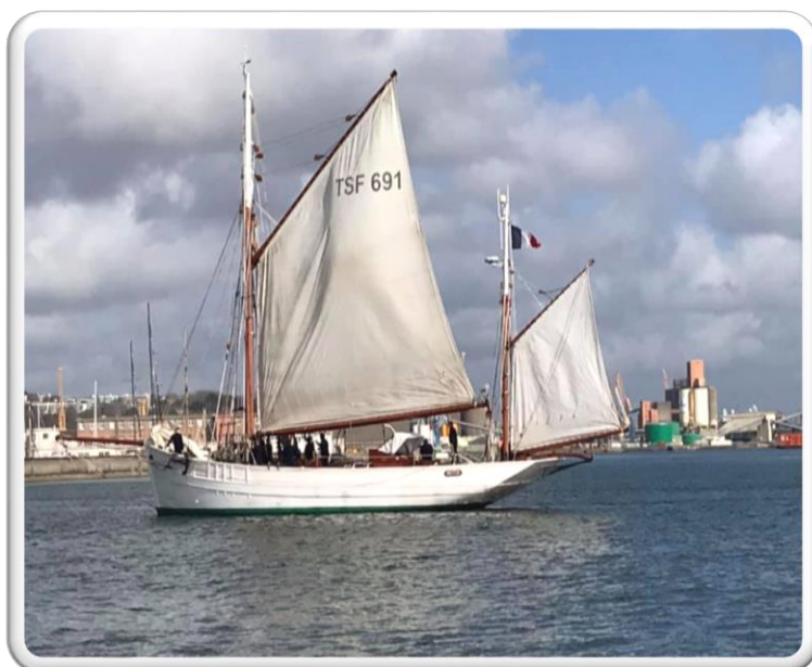
Embarquement à bord du mutin

Un peu d'histoire : L'embarcation doyenne de la Marine nationale ! Plus vieille unité navigante, mise en service en 1927, le Mutin est un cotre qui a servi de bateau-espion durant la Seconde Guerre mondiale au sein du Special Operations Executive anglais. Rendu à la Marine en 1945, il vit désormais une retraite heureuse en tant que navire école.