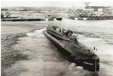
Lancement, le 29 mars 1967