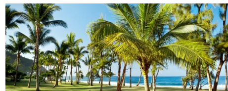
Un rayon de soleil de La Réunion