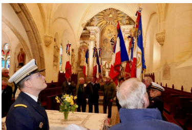
Dans l'église de Tocqueville

Elus locaux, familles et représentants des amicales ont répondu présent à l'invitation de l'amicale Ondine pour rendre, 50 ans après, un hommage aux marins de l'Eurydice.