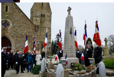
Devant le monument aux morts de Brillevast