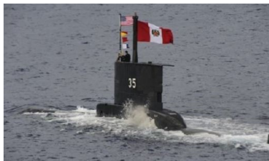
Sous-marin BAP Islay, type 209/1100, de la marine du Pérou.

L'entretien W5 du moteur diesel MTU implique l'exécution d'une révision partielle, étant donné que la révision complète est appelée W6. Dans l'immédiat, l'achat de pièces détachées pour les travaux de maintenance prendra environ quatre mois.